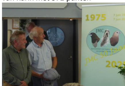
Onthulling JMC jubileum logo 50 jaar JMC. Door het lid dat tot zich als een van de eerste JMC mocht noemen.